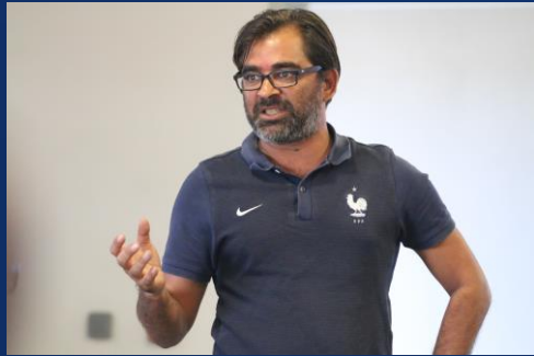
Gangate Hosman CTR