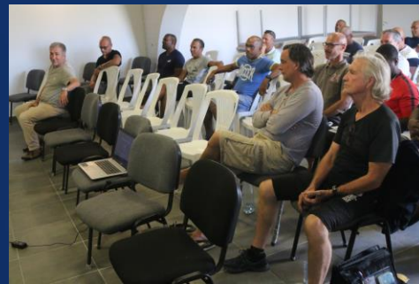
DT D1 Départementale